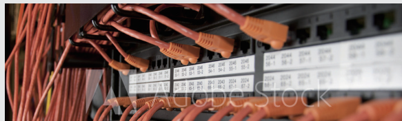
从一堆杂乱的硬件