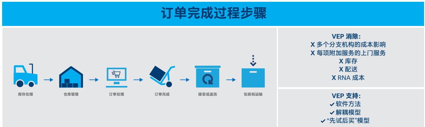
图 2. 通过 uCPE 远程部署的仓储周期