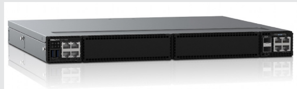
到搭载英特尔® 至强® D-2100 处理器的 戴尔 EMC VEP 4600* 通用 CPE